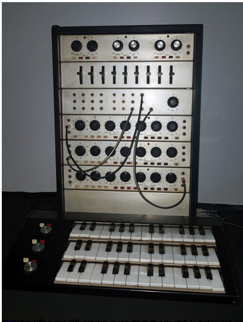
Moog Modular Synthesizer Moog Modular Synthesizer Moog Modular Synthesizer